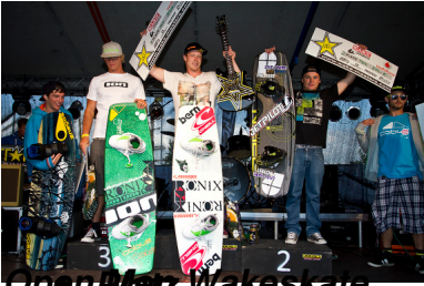
Open Matz Wakeskate

Geschrieben von: Benjamin Wiedenhofer Dienstag, 26. Juni 2012 um 17:00 Uhr