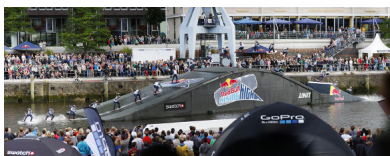
Raph Derome und sein 1080 zum Sieg

„Das Riding-Level war extrem hoch. Da wir die ganze Woche zusammen trainiert hatten, wusste man schon ungefähr, was die anderen vermutlich auspacken würden, aber heute haben sich alle noch mal ein wenig gesteigert. Für mich war Red Bull Rising High bis jetzt ganz klar ein Highlight der Saison und einfach richtig cool!“