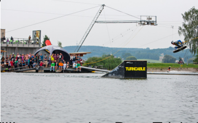
McNair-Trickberg 70 Punkte Thomas Reimer 48.07