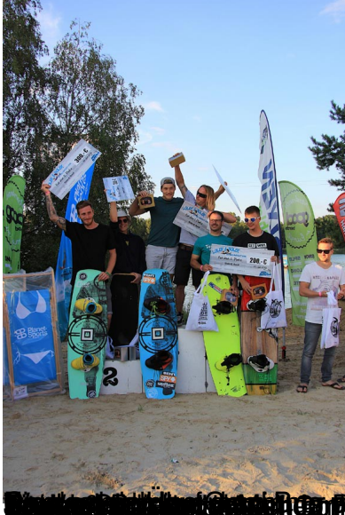
Die Gewinner des Contests sind im Bild zu sehen. Von links nach rechts: Der Sieger, der Zweitplatzierte und der Drittplatzierte.