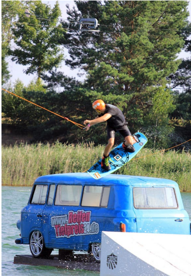
Ein Highlight des Contests ist das „Bolekt“-Feature des Contests

Geschrieben von: Benjamin Wiedenhofer Freitag, 05. August 2016 um 09:00 Uhr