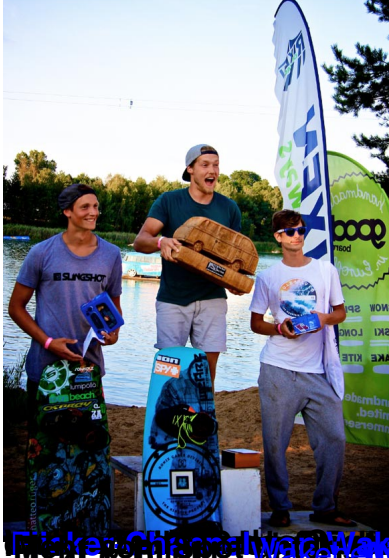
Die Gewinner des Contests sind im Bild zu sehen. Von links nach rechts: Der Sieger, der Zweitplatzierte und der Drittplatzierte.