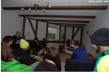
Einige Rope-Addicts bei der privaten Premiere in Thulba

eine HD-Cam zukommen lassen, was mich sehr neugierig darauf machte, zu sehen ob man auch mal gute Quali in einem selbstgemachten Film haben kann. Dann hab ich auf MAC umgestellt was eine sehr gute Entscheidung war. Und dann kam eben der Sommer, es kamen neue Songs und neue Ideen die ich gerne in Videoparts verwenden wollte, und es kamen einfach auch sehr viele Fragen ob es ein Video 2009 geben wird. Und schon konnte ich nicht mehr nein sagen.